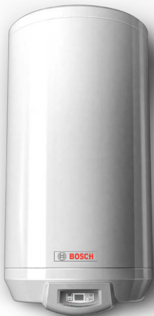
ES 075-5 E