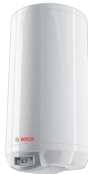
ES 100-5 E