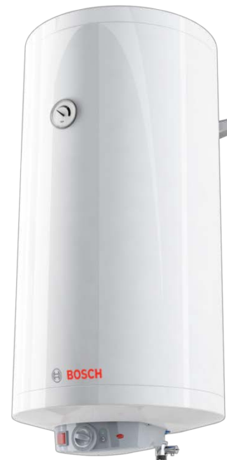
ES 120-5 M